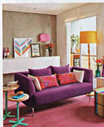
REPORTAGEM VISUAL: JULIANA CORVACHO

32 JOGO DOS 5 ACERTOS Cozinha prática com direito a ilha Escolhas precisas em um ambiente que prima por funcionalidade e beleza.